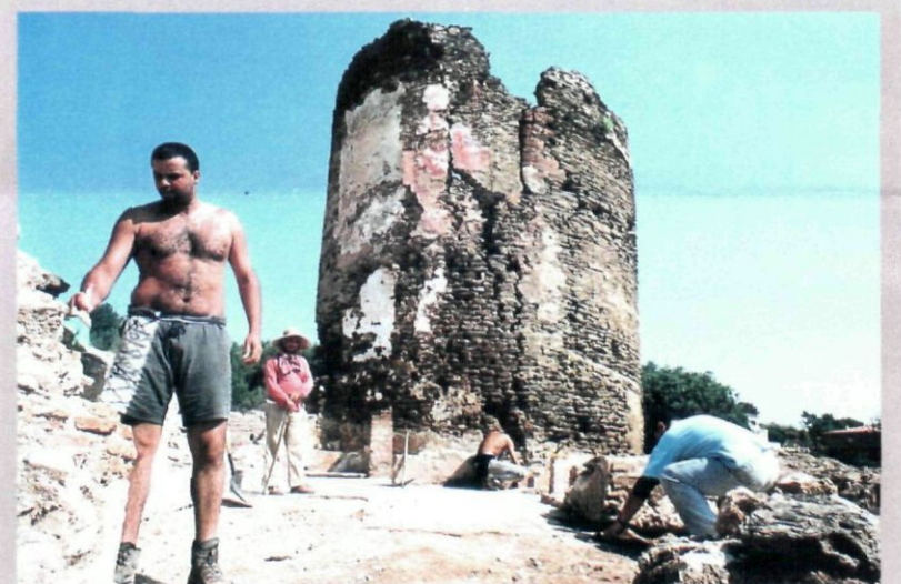
La torre de Benviure es restaurarà properament

L'excavació feta a la torre de Benviure es va plantejar com un treball de recerca previ al projecte de restauració de la torre i de condicionament i millora del seu entorn. Aquesta torre, emplaçada al barri de Can Paulet, està documentada des del segle XI. Els treballs arqueològics han permès estudiar-ne l'evolució i han posat al descobert les antigues edificacions que l'envoltaven des del moment que es va construir. Es tracta de les restes de les parets de l'antiga casa medieval i diversos elements d'aquesta edificació: un enllosat, una llar de foc, un pou i un bon nombre de sitges amb gran quantitat de ceràmica datada dels segles XI-XIV. També s'han trobat, d'aquest mateix període, unes parets que podrien correspondre a l'antiga capella de Sant Miquel, restes d'una masia construïda al segle XVI i un darrer edifici que va ser habitat fins a mitjan segle XX. L'excavació l'ha feta un equip diferent al de Can Barraquer.