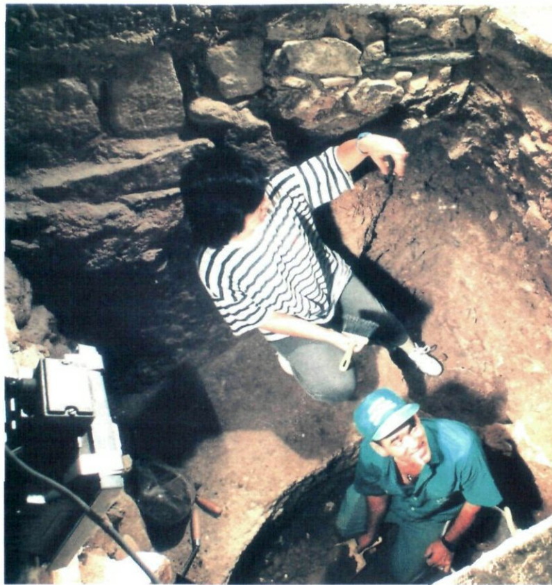
L'equip arqueològic treballa a Can Barraquer

Un equip d'arqueòlegs contractat per l'Ajuntament mitjançant un pla d'ocupació és l'encarregat de dur a terme la prospecció arqueològica. Gràcies a aquesta, s'han pogut documentar paviments i restes de pintures murals romanes i objectes d'ús per-