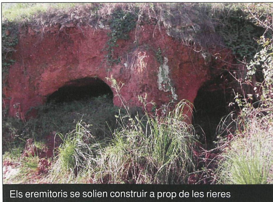
Els eremitoris se solien construir a prop de les rieres

El patrimoni arqueològic de Sant Boi acaba d'enriquir-se amb noves troballes. Les han fet dos equips de treballadors que duen a terme tasques de desbrossament i neteja a diferents indrets naturals de la ciutat. El Museu de Sant Boi ha identificat les troballes com a eremitoris rupestres (habitatges excavats a la roca) de l'alta edat mitjana.