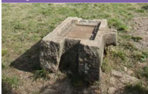
Font de pedra