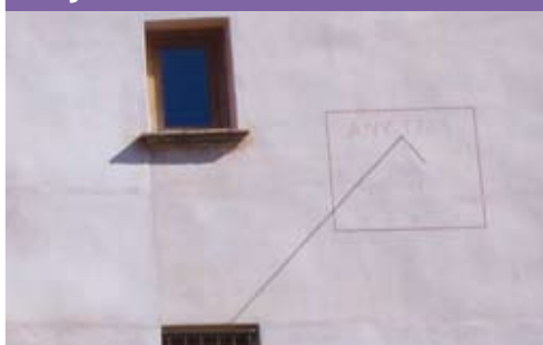
Rellotge de sol