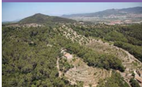
Panoràmica de l'entorn