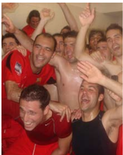
Els jugadors del Santboià celebren l'èxit

A partir de l'any vinent, Santbo formarà part de les cercaviles que protagonitzin els gegants, gegantons i capgrossos de la ciutat.