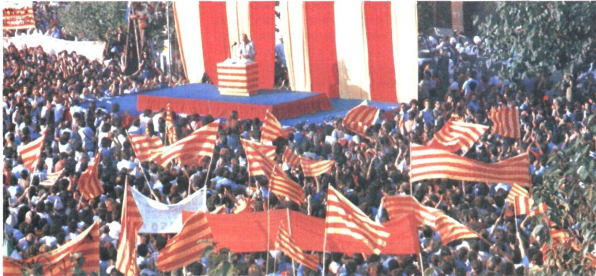
La diada de 1976 va aplegar una multitud reclamant llibertat, amnistia i Estatut d'Autonomia

L'acte central es celebrarà a partir de les sis de la tarda a la plaça de Catalunya. Començarà amb una